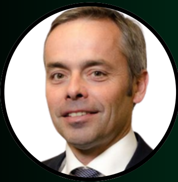
Pierre Jacquot Edmond de Rothschild REIM